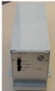
Bloc KFS dans son coffret