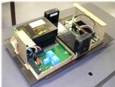
Balise KFSI, vue intérieur