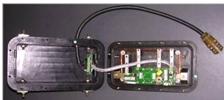
Capteur KFS vue interne