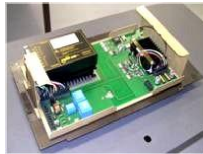
Balise KFSI, vue intérieur