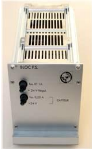
Bloc KFS vue de face