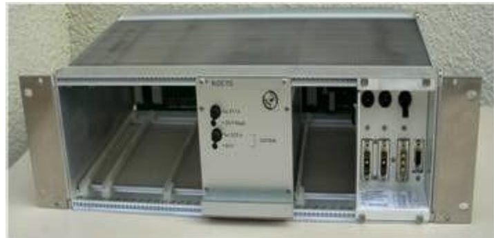
Bloc KFS dans son rack