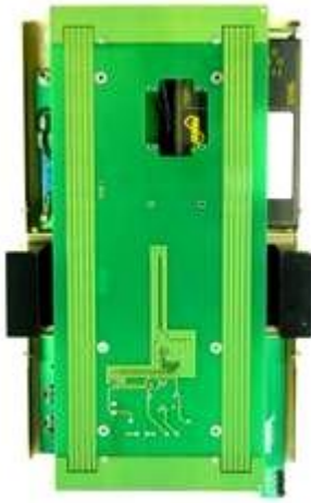
Balise KFS (vue interne)