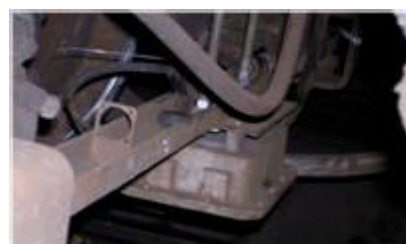
Capteur KFS monté sur train