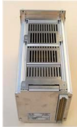
Bloc KFS vue de dos